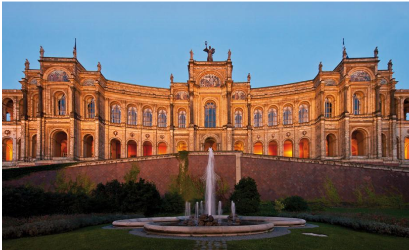
Das Maximilianeum – Sitz des Bayerischen Landtags

Am Festabend hatten die CTAC-Mitglieder die Gelegenheit, das eindrucksvolle Maximilianeum auch einmal von innen kennenzulernen.